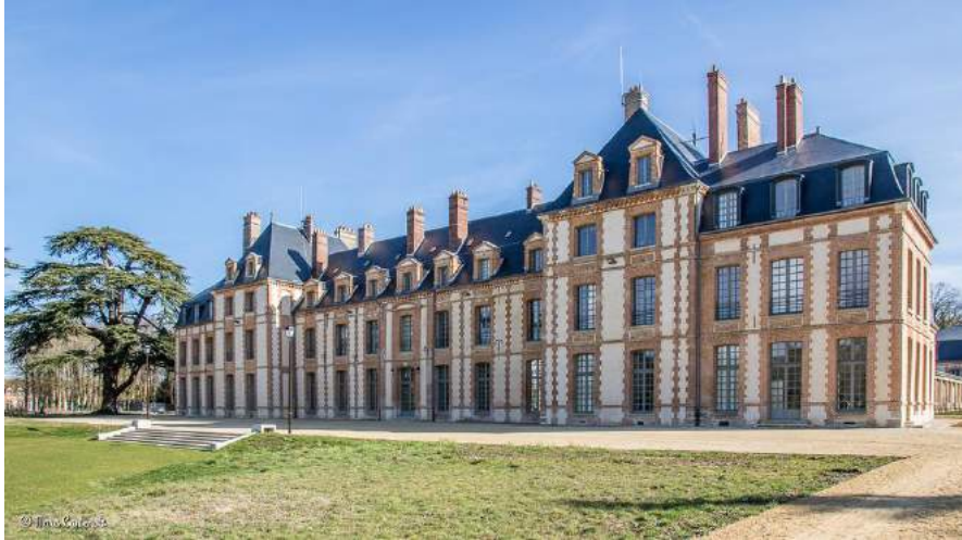
Appartements et studios dans le château d'Abondant récemment réhabilité

-Autres hôtels : à Dreux (28100), 15mn en voiture de Sorel-Moussel. Hébergements moins charmants mais faciles d'accès et aux disponibilités presque assurées